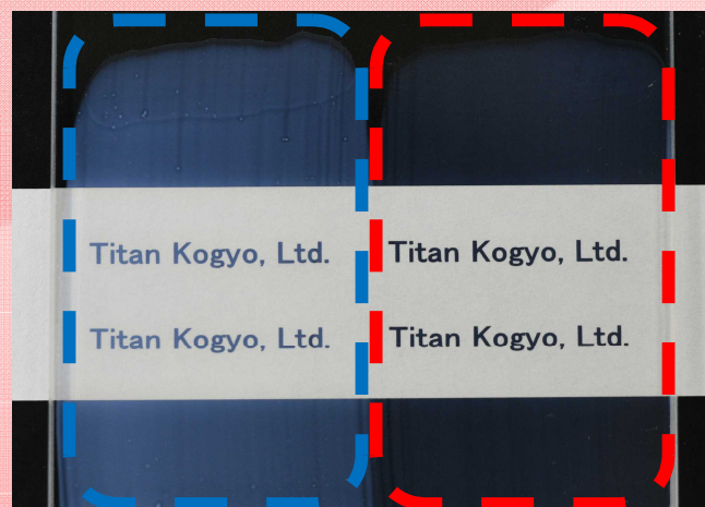
汎用品 (10nm) General nano grade